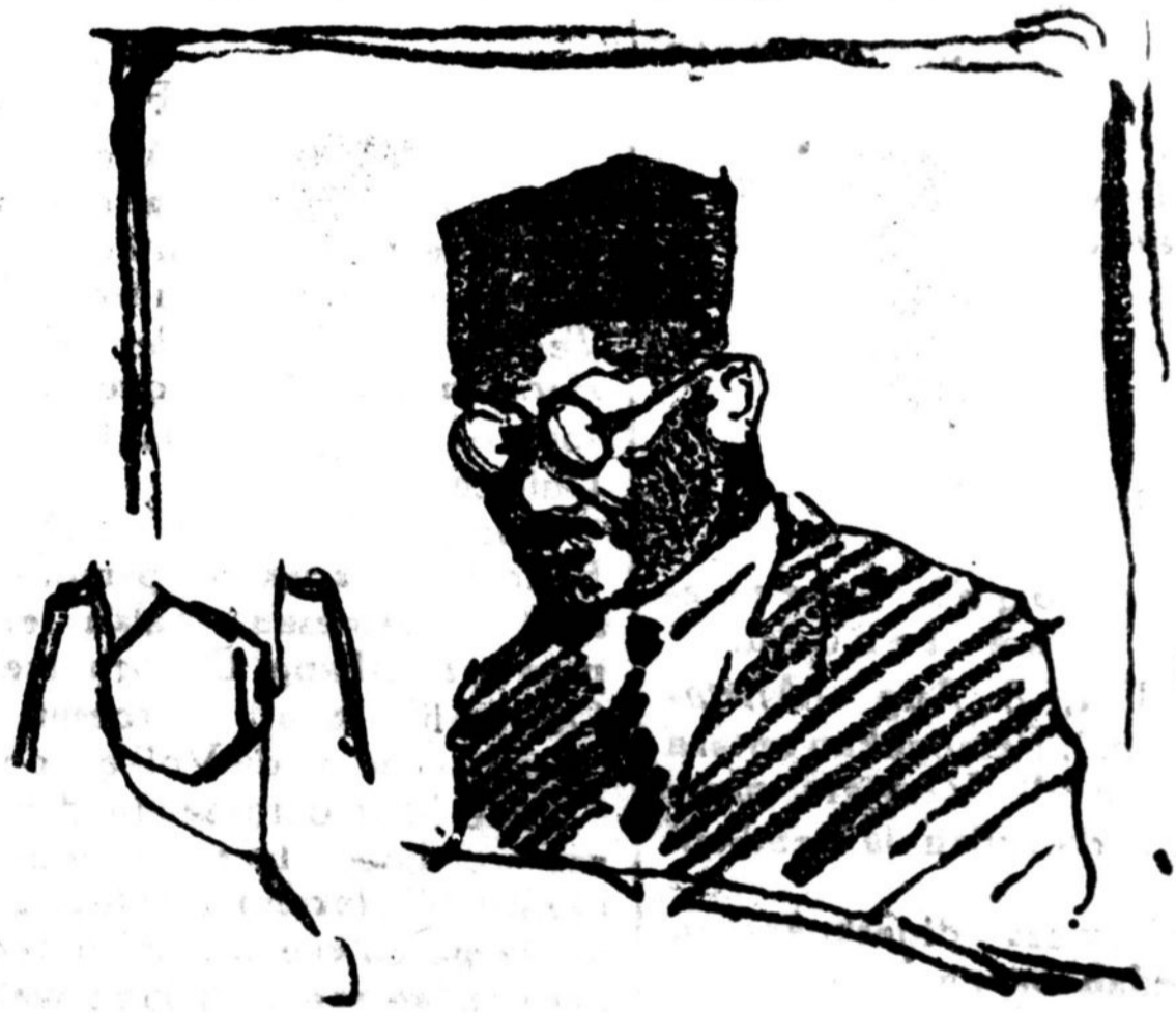
Gambar toean MOCHTAR BIN PRABOE MANGKOENEGORO Lid Volkraad, salah seorang pembijtjara dalam C.I.R